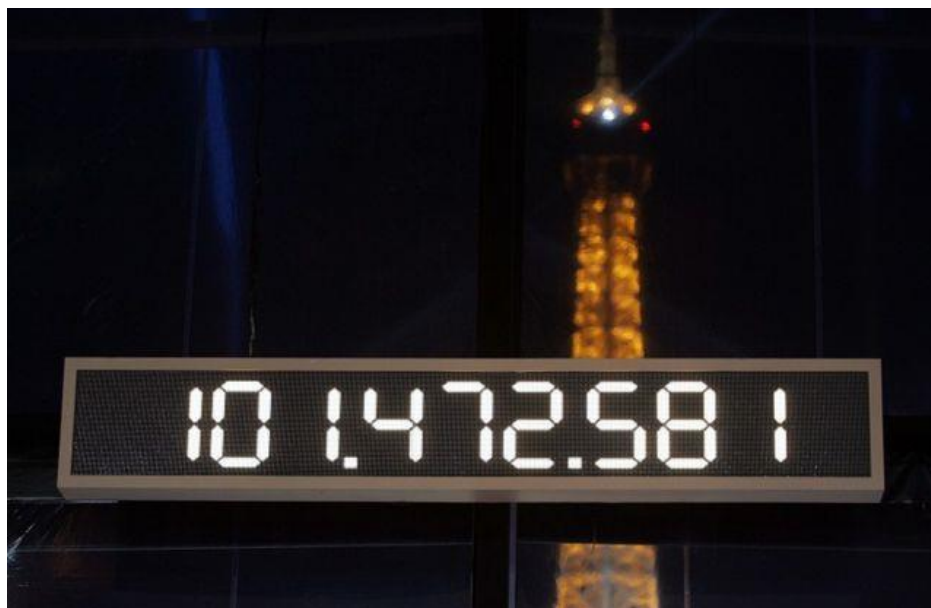
Le compteur du Téléthon recueille des dizaines de millions d'euros de dons chaque année

Les Français n'ont jamais autant donné à des œuvres caritatives : c'est ce qu'il ressort du rapport annuel du réseau Recherches et Solidarités.