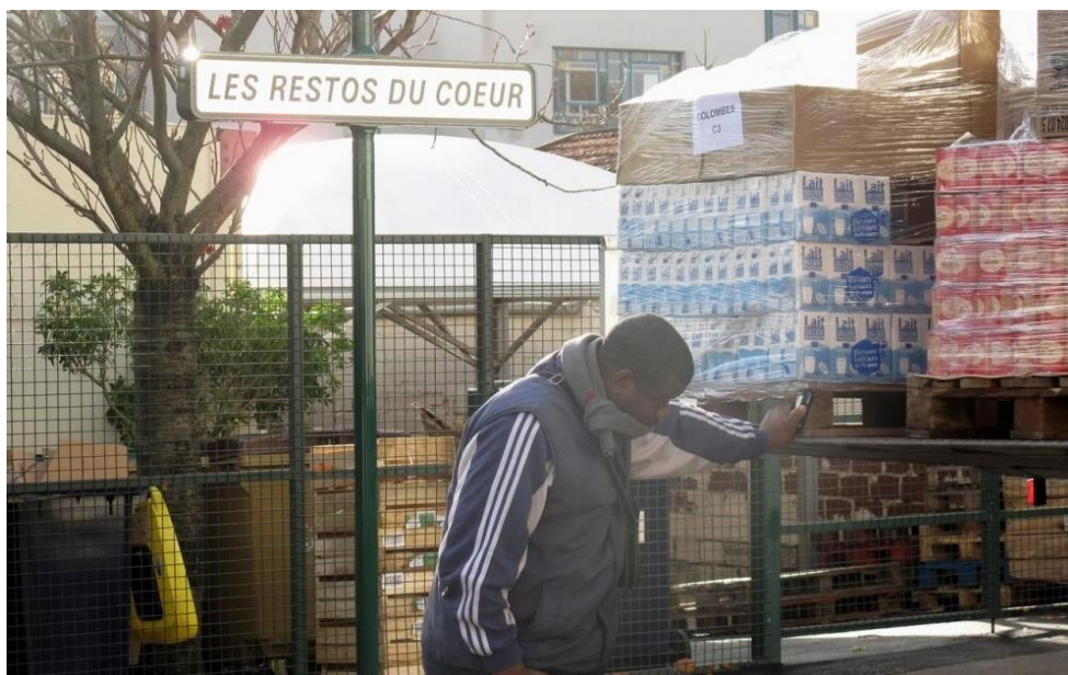
ILLUSTRATION. Les Restos du cœur sont toujours autant aimés des Français.

Le 26 septembre 1985, en direct sur Europe 1, Coluche lançait une « petite idée comme ça » qui débouchait, trois mois plus tard, sur la naissance des Restos du cœur à l'intention des personnes démunies. A l'époque, l'humoriste imaginait une initiative éphémère.